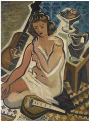
52 GINO SEVERINI Cortona 1883-1966 Paris

Zuschlag (inkl. Aufgeld) CHF 276'600 | EUR 184'400 | USD 251'455