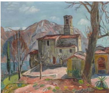
54 HANS PURRMANN Speyer 1880-1966 Basel

Zuschlag (inkl. Aufgeld) CHF 153'640 | EUR 102'427 | USD 139'673