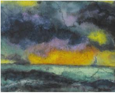
53* EMIL NOLDE Nolde 1867-1956 Seebüll