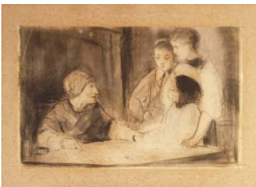
1265 ALBERT ANKER Ins 1831-1910 Ins

Zuschlag (inkl. Aufgeld) CHF 39'600 | EUR 26'400 | USD 36'000