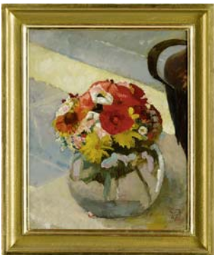
67 CUNO AMIET Solothurn 1868-1961 Oschwand

Zuschlag (inkl. Aufgeld) CHF 37'200 | EUR 24'800 | USD 33'818