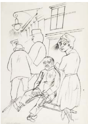
48 GEORG GROSZ Berlin 1893-1959 Berlin

Zuschlag (inkl. Aufgeld) CHF 78'000 | EUR 52'000 | USD 70'909