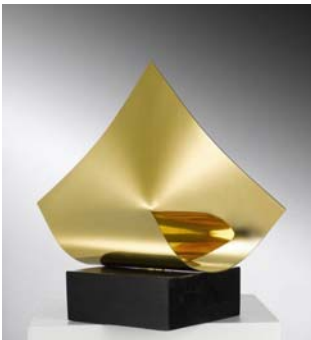
176 MAX BILL Winterthur 1908-1994 Berlin

Zuschlag (inkl. Aufgeld) CHF 61'200 | EUR 40'800 | USD 55'636