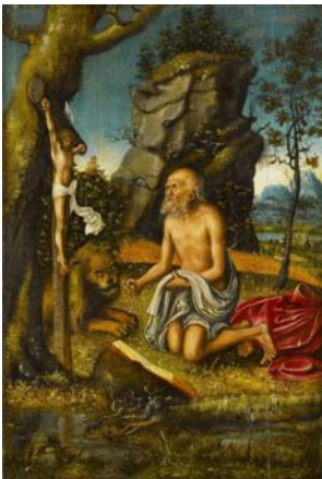
1003* LUCAS CRANACH D. Ä. UND WERKSTATT Kronach 1472-1553 Weimar