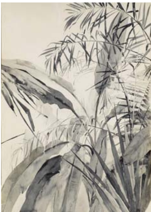
44 AUGUSTO GIACOMETTI Stampa 1877-1947 Stampa

Zuschlag (inkl. Aufgeld) CHF 54'000 | EUR 36'000 | USD 49'091