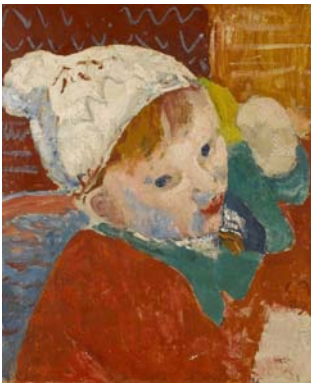
69 CUNO AMIET Solothurn 1868-1961 Oschwand