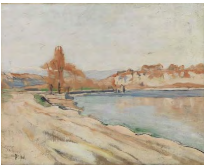
47 FERDINAND HODLER (Bern 1853-1918 Genf) An der Jonction

Unten links monogrammiert "F.H.". Rückseitig auf dem Keilrahmen Etikette der Galerie Aktuaryus Zürich und kleine Etikette mit Nr. 30124 (SIK).