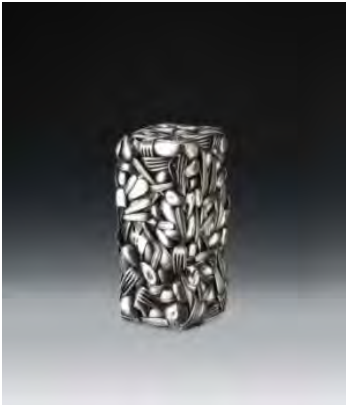
113* CÉSAR eigentlich CESAR BALDACCINI (Marseille 1921-1998 Paris) Kompression aus Gabeln und Löffeln

Unten rechts auf einem Löffel signiert "César". Kompression aus Gabeln und Löffeln, H = 34,5 cm