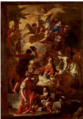
1103 FRANCESCO SOLIMENA (Canale di Serino 1657-1747 Barra) Die Anbetung der Hirten

Wir danken Herrn Pierre Rosenberg für die Bestätigung der Eigenhändigkeit Gabriel François Doyens dieses hier angebotenen Gemäldes an Hand der ihm vorgelegten Fotografie.