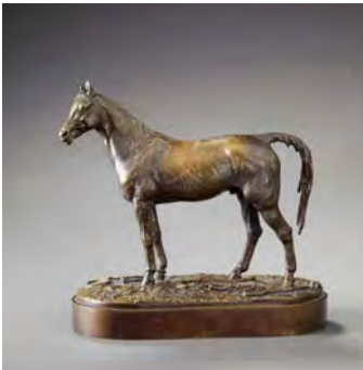
3983 EUGENE ALEXANDROVITCH LANCERAY (1848-1886 St. Petersburg) Arabischer Hengst

Zuschlag (inkl. Aufgeld) CHF 15'600 | EUR 11'729 | USD 16'082