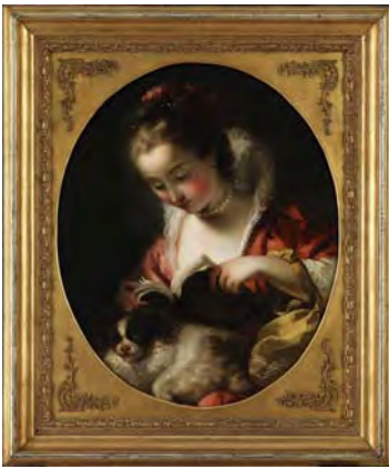
1113* GABRIEL FRANÇOIS DOYEN (Paris 1726-1806 St. Petersburg) "La Lecture"

Auf der Rückseite Rest eines Siegels mit der Kaiserkrone. Die Siegelreste mit der russischen Kaiserkrone lassen den Schluss zu, dass sich das Gemälde höchstwahrscheinlich in Zaren- oder Grossfürstenbesitz befand.