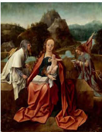
1005* JAN DE BEER zugeschrieben (Tätig in Antwerpen 1490-1515) Madonna mit Kind in einer Landschaft sitzend, flankiert von Engel und Pilger