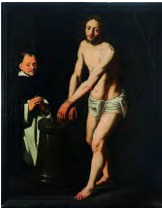
1010* FRANCISCO DE ZURBARÁN (Fuente de Cantos 1598-1684 Madrid) Christus an der Geisselsäule mit knieendem Dominikaner

Oben links eine Widmungsinschrift mit der Altersangabe des Mönchs "AETATIS SVEA 55" und der Datierung "ANNO 1620". Öl auf Lwd., 116 x 91 cm