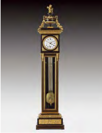
3658 Standuhr, Louis XVI., Paris, um 1775

Ebenholzgehäuse mit verglaster Front und Vasenaufsatz. Ziselierte und vergoldete Bronzen. Emailzifferblatt mit römischen Stunden- und arabischen Minutenzahlen, grosse Sekunde. Oberhalb VI Aussparung mit Datums- und Monatsanzeige. Das Blatt bezeichnet "Lepaute". Scherenhemmung, Mechanismus für Halbstundenschlag auf Glocke, Schlaghammer fehlt. Kompensationspendel. Das Gehäuse signiert "N.PETIT", darüber und darunter Innungsstempel. Auf der Platine bezeichnet "Lepaute H(orlog)er du Roi (à) Paris". Sockelteil um 1790/1800 ergänzt. H = 255 cm