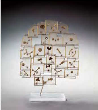
175 GÜNTER HAESE (Geb. 1924 in Kiel) Maestra

Zuschlag (inkl. Aufgeld) CHF 48'000 | EUR 36'090 | USD 49'485